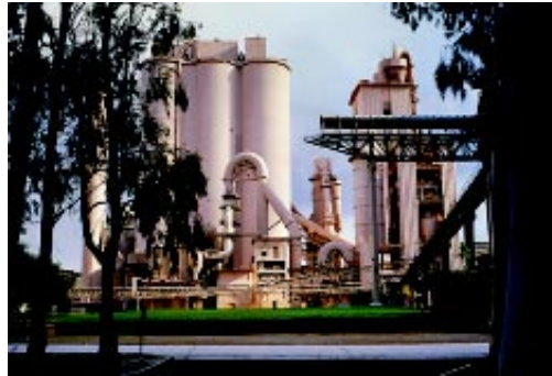
Una de las Plantas de Cemento de la Zona de Olavarría