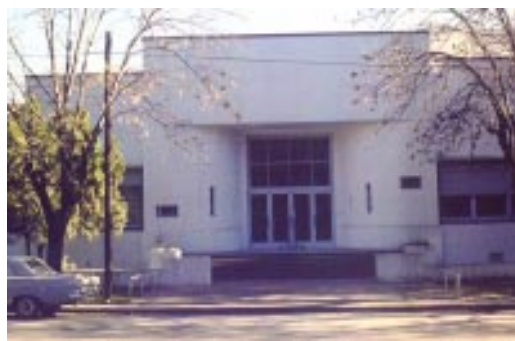
Sede del LEMIT