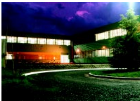
Facultad de Ingeniería Universidad Nacional del Centro de la Provincia de Buenos Aires