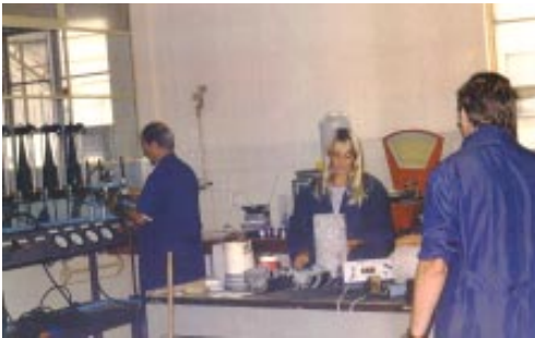
Uno de los laboratorios del LEMIT