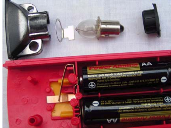
Figura 1: Despiece de una linterna. Las partes conservan la posición en que están montadas